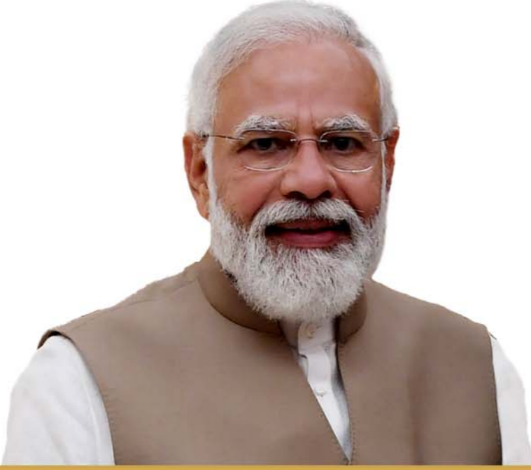
શ્રી નરેન્દ્રભાઈ મોદી માન. વડાપ્રધાન

આવો, સહુ સાથે મળી, સહકારી ચળવળને વેગવંતી બનાવીએ