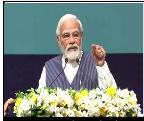
डिजिटल इंडिया ने बदला सेवाओं का तरीका - नरेन्द्र मोदी