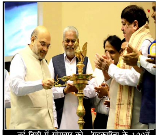
नई दिल्ली में सोमवार को 'सहकारिता के 100वें अंतर्राष्ट्रीय दिवस' के अवसर पर आयोजित एक समारोह में दीप प्रज्ज्वलित करते हुए केंद्रीय गृह और सहकारिता मंत्री अमित शाह।

R.N.I. No. 63177/95 वर्ष:27 अंक: 202 दिनांक:05-07-2022 मंगलवार मूल्य : 1 रूपया 50 पैसा पृष्ठ:4+2 अहमदाबाद M