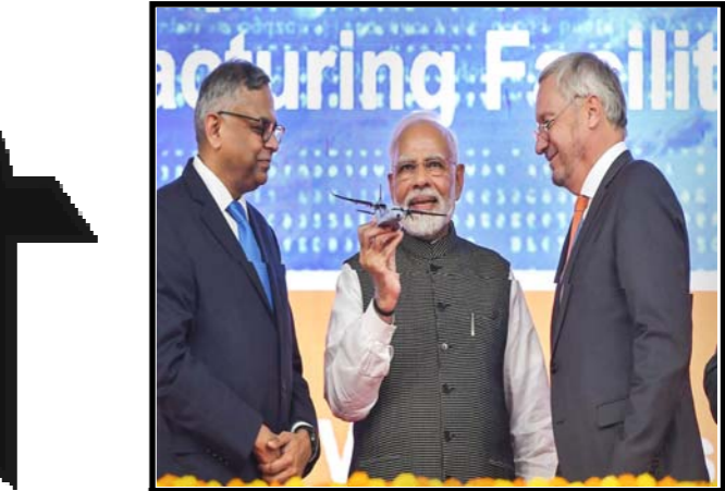
रक्षा अधिकारी के अनुसार विमान के निर्माण का यह कदम भारत को डिफेंस के क्षेत्र में आत्मनिर्भर बनाने के लिए लिया गया है। केंद्र सरकार ने भी आत्मनिर्भर भारत को तेजी देने के लिए सेना के कई सारे उपकरणों का निर्माण भारत में कराना शुरू कर दिया है।

कांग्रेस के वरिष्ठ नेता ने ठभाजपा विचारकठ का नाम लिए बिना कहा, ठउन्होंने ( भाजपा के विचारक) मुझे ये संदेश भेजा: अजीब बात ये है, नेहरू को बदनाम करना एक बात है, लेकिन