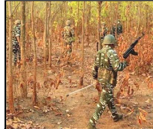
उत्तीसगढ़ के गढ़चिरोली में सुरक्षाबलों और नक्सलियों के बीच मुठभेड़ शुरू हो गई है। इस एनकाउंटर में सेना के जवानों ने 12 नक्सलियों को डेर कर दिया है।