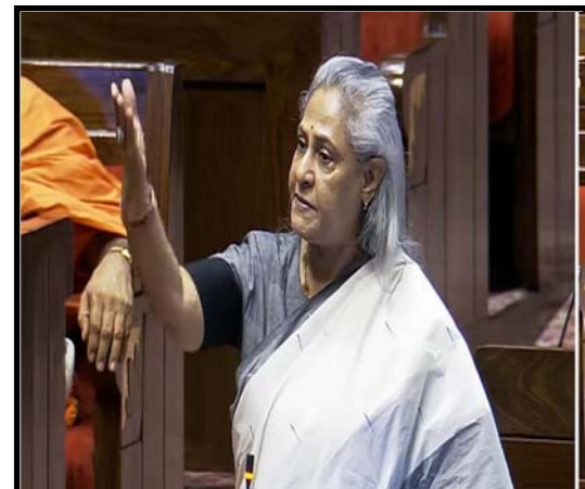
राज्यसभा की कार्यवाही के दौरान उपराष्ट्रपति जगदीप धनखड़ और सांसद जया बच्चन के बीच बहस हो गई। जया बच्चन ने धनखड़ की 'टोन' पर आपत्ति जताई थी, जिसके बाद उपराष्ट्रपति ने इस आपत्ति पर कड़ा एतराज जताया।