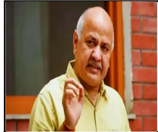
सुप्रीम कोर्ट ने शुरुवार को मनीष सिसोदिया की जमानत के वक्त 'जमानत नियम है और जेल अपवाद' सिद्धांत का हवाला दिया। मनीष सिसोदिया 26 फरवरी 2023 से जेल में बंद थे।

R.N.I. No. 63177/95 वर्ष:29 अंक:240 दिनांक:10-08-2024 शनिवार मूल्य:1 रूपया 50 पैसा पृष्ठ:4 अहमदाबाद M