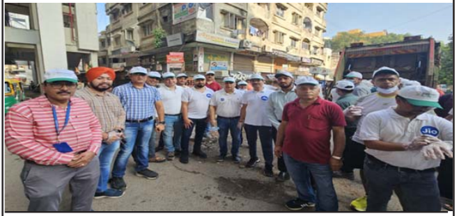
स्वच्छता को बढ़ावा देने के उद्देश्य से स्वच्छता ही सेवा 2०24 पहल में भाग लेने पर रिलायंस फाउंडेशन को गर्व है। रिलायंस फाउंडेशन ने 1 अक्टूबर, 2०24 को थलतेज क्रांति रोड, अहमदाबाद में स्वच्छता अभियान #WE CARE4SWATCHHATA चलाया.

उधर, पता चला है कि युवती मानसिक रूप से अवसादग्रस्त होने के कारण उसे इलाज के लिए नेपाल भेजा गया है.