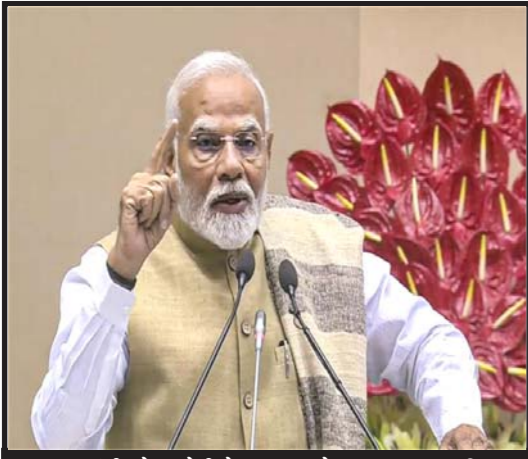
प्रधानमंत्री नरेन्द्र मोदी ने बुधवार को स्वच्छ भारत अभियान को इस सदी में दुनिया का सबसे बड़ा और सबसे सफल जनआंदोलन करार दिया और कहा कि 'विकासित भारत' की यात्रा में हर प्रयास 'स्वच्छता से संपन्नता' के मंत्र को मजबूत करेगा।