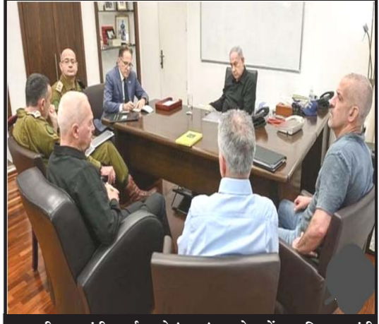
इराइली प्रधानमंत्री कार्यालय ने 'एक्स' एक पोस्ट में कहा कि प्रधानमंत्री नेतन्याहू ने आज दोपहर सुरक्षा प्रतिष्ठान के प्रमुखों के साथ चर्चा की। अमेरिकी नौसेना के विध्वंसक इराइली वायु सेना के साथ मिलकर ईरानी मिसाइलों को इंटरसेप्ट करने के लिए तैयार हो गए हैं।

R.N.I. No. 63177/95 वर्ष:29 अंक:292 दिनांक:03-10-2024 गुरुवार मूल्य:1 रूपया 50 पैसे पृष्ठ:4 अहमदाबाद M