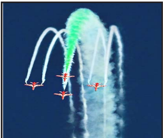
6 अक्टूबर 2024 को चेन्नई के मरीना बीच पर भारतीय वायु सेना के एयर शो का पहला दिन यह शानदार एयर शो 8 अक्टूबर को मनाई गई IAF की 92वीं वर्षगांठ के हिस्से के रूप में आयोजित किया जा रहा है।